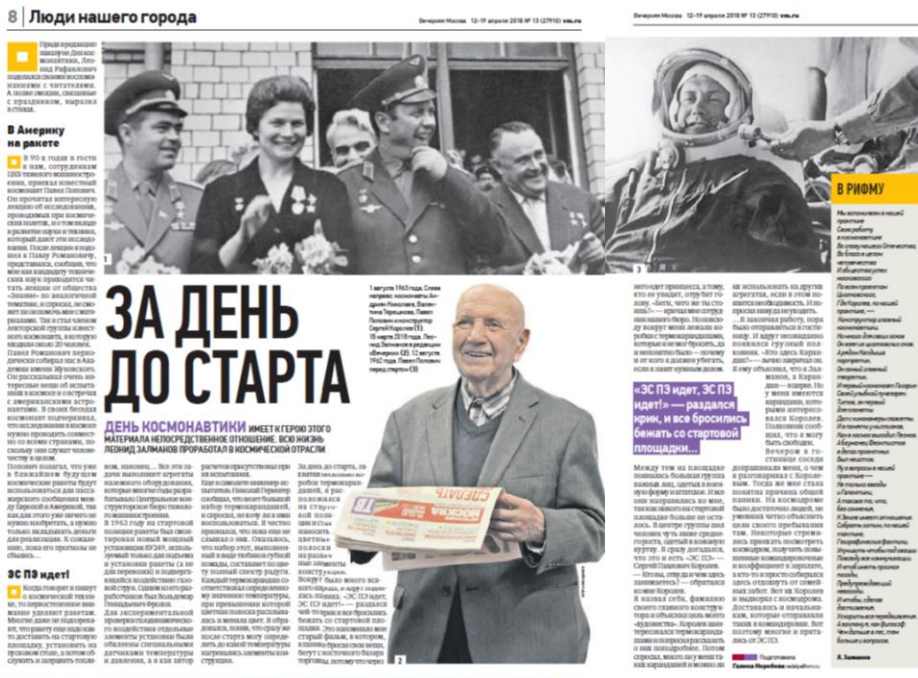
«Вечерняя Москва» 12-19.04.2018 №13 (27910) vt.ru

На личном приеме к московскому омбудсмену обратился отчаявшийся 92-летний житель района Замоскворечье, ветеран труда космической отрасли, награжденный Орденом «Знак Почета», проживающий с 87-летней супругой, страдающей заболеванием суставов ног, по вопросу отсутствия в районе низкопольных трамваев, приспособленных для маломобильных пассажиров.